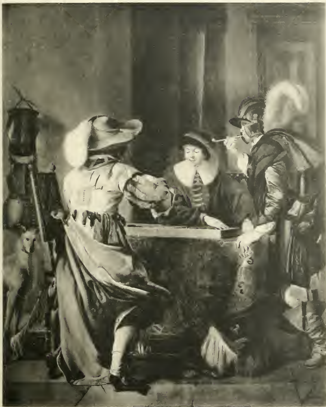
W. C. DUYSER

TERCENTENAIRE DE REMBRANDI - EXPOSITION FREDERIK MULLEK & CIE.